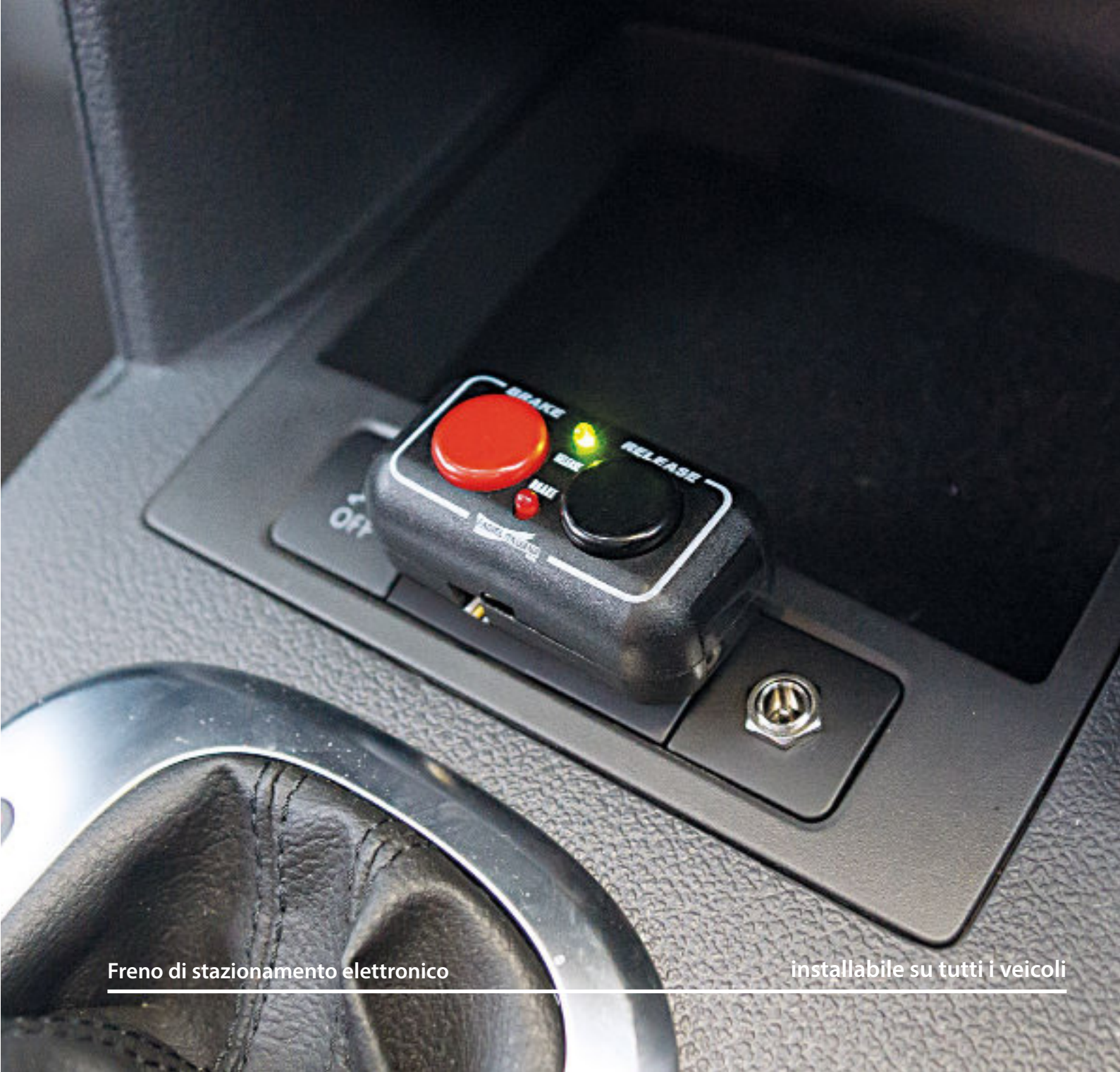
Freno di stazionamento elettronico