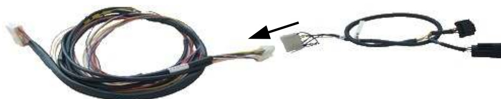
CABLAGGIO CENTRALINA INTERFACCIA

ATTENZIONE: per la centralina interfaccia versione SENT è obbligatorio.